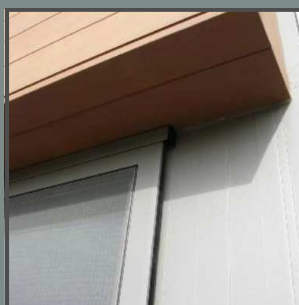
Détail rail du haut de porte coulissante.