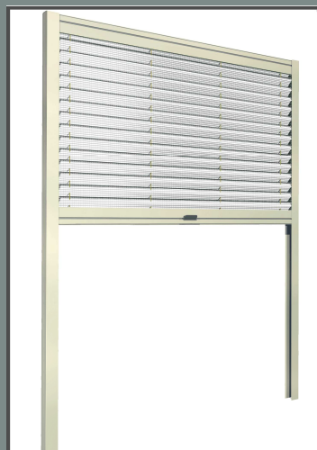
Moustiquaire plissée à refoulement vertical pour fenêtres, avec glissières latérales.