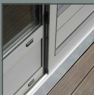
Détail rail inférieur de porte coulissante.