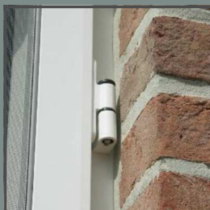
Charnière pour porte moustiquaire battante.